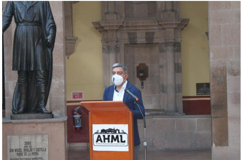
Arq. Rodolfo Herrera, autor. AHML. 2021.