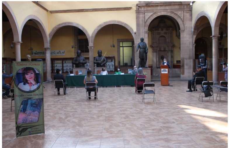
Presentación del libro Pintores Leoneses. AHML. 2021.

El evento se encuentra disponible en apartado de videos del Facebook oficial del AHML: https://www.facebook.com/103423118410295/videos/813125176228563 Enlace de notas de periódicos sobre el evento: https://www.heraldoleon.mx/divulga-a-pintores-leoneses/