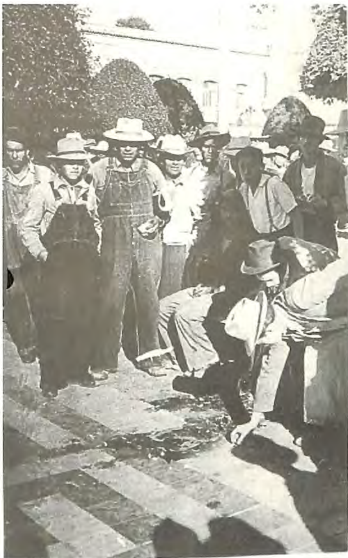
La gente observa la sangre derramada en el suelo.