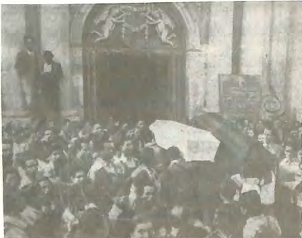
La Parroquia recibe los cuerpos de las víctimas.