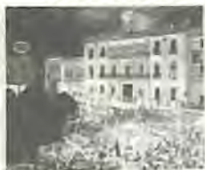
Portada: Alegoría del 2 de Enero. Lorenzo Zambrano.