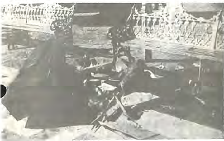
La Plaza Principal al amanecer el día 3 de enero.

La siguiente narración corresponde al Reporte Detallado de los Terribles Acontecimientos de León , que el Teniente Francisco E. Mireles envió al Presidente de la República: Eran las 9:00 de la noche en punto, cuando se oyó un trueno claro, como un cuete (sic) y luego un disparo como de pistola y se desató una enorme balacera. A los golpes secos de los máuseres pronto se impuso el tableteo de las ametralladoras Thompson que estrenaba el ejército. La gente aterrorizada empezó a correr en todas direcciones, ciega de pánico, en busca de una salida, pero coches particulares y vehículos militares las habían bloqueado todas. Los gritos de miedo y los ayes de dolor se mezclaban a las maldiciones de los atacantes, y al estruendo de los balazos. 49