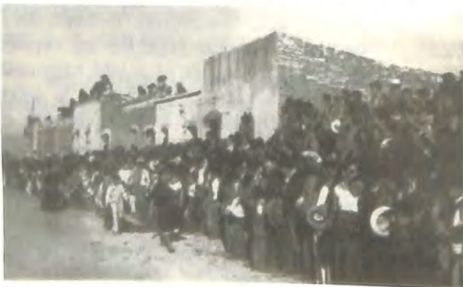
León en duelo.