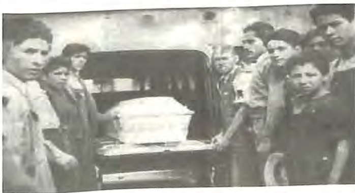
Traslado de féretros.