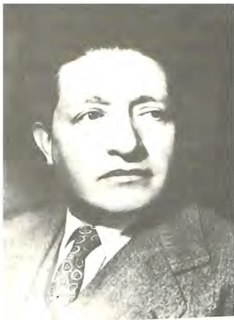
El Gobernador Ernesto Hidalgo, cesó en sus funciones el 8 de enero de 1946.

El 8 de enero el Senado de la República expidió la declaratoria de desaparición de poderes, acto con el que el Gobernador Ernesto Hidalgo, periodista de profesión, cesó en sus funciones. 68