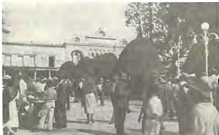
Desde las 10:00 hrs. del 2 de enero los partidarios de la UCL ya se habían reunido en la Plaza Principal.

Todo era una efervescencia y entre especulaciones fueron transcurriendo las horas, rumores aquí, rumores allá, pero el más fuerte era que el Presidente Ilegítimo, estaba decidido a renunciar.