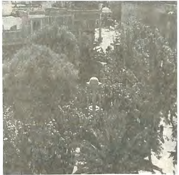
La Junta Computadora de la UCL quedó instalada en el Jardín de La Industria.