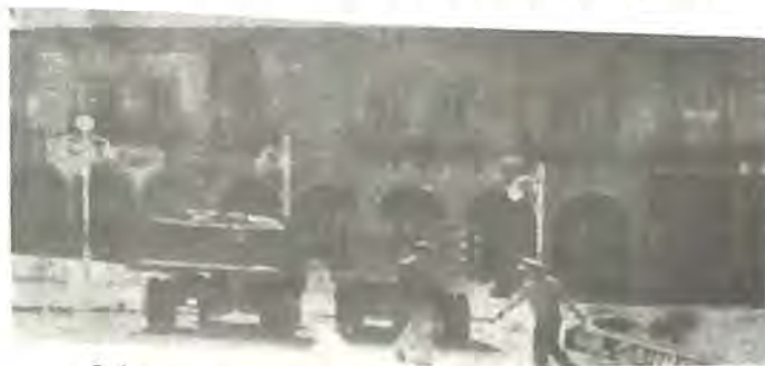
3 de enero de 1946, el despertar a la cruda realidad.

Hoy, a 70 Años de acontecido este importante episodio de nuestra historia, recordamos en nuestras páginas este evento, del cual finalmente usted tendrá la mejor opinión.