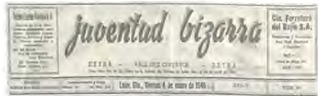
Juventud Bizarra periódico leonés, el 4 de enero de 1946, señaló arriba de 300 lesionados y más de 40 defunciones.

Venustiano Carranza en su última travesía por la sierra de Puebla y que derivó en su asesinato, en su carácter de Secretario de la Defensa Nacional, señaló como saldo 22 muertos y 70 heridos; aunque la vox pópuli hablaba de 30 fallecidos y 300 heridos. 73 La SCJN estimó 300 heridos y 40 muertos. 74