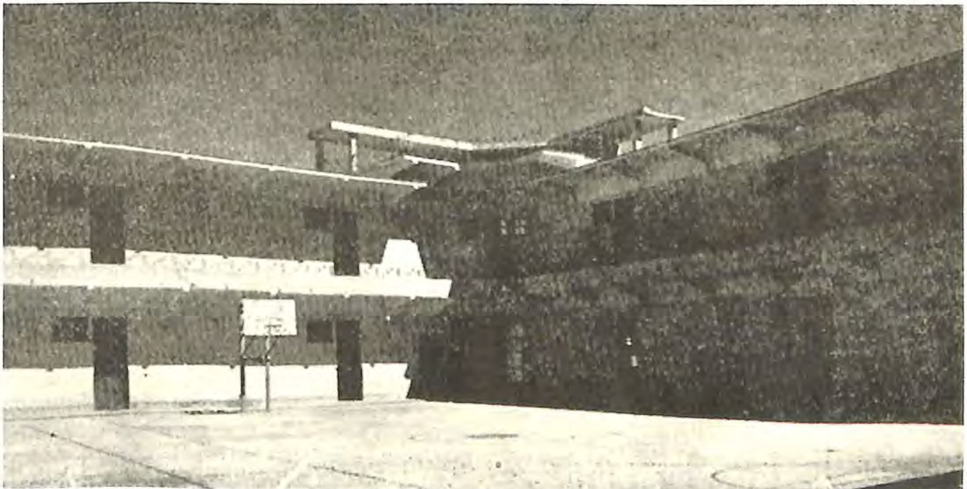
Interior de la Escuela Prevocacional de León. (1938-1939).