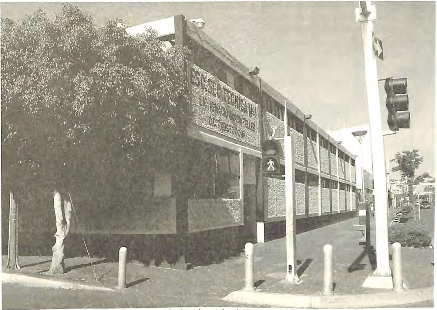
Escuela Secundaria Técnica No. 1, ubicada en la esquina del Bulevar Adolfo López Mateos y 20 de Enero.

industrial de orgullo para la economía nacional de primer orden, con más de 15 mil zapateros, curtidores, hilanderos y tejedores.