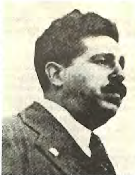
Lic. Ignacio García Téllez, Secretario de Gobernación en 1939, año de inauguración de la Escuela Prevocacional.