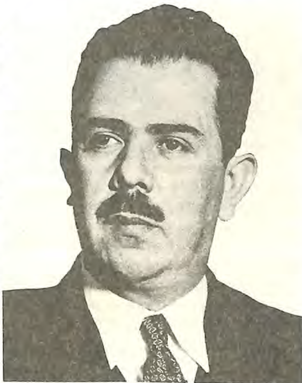
Gral. Lázaro Cárdenas, Presidente de los Estados Unidos Mexicanos. Durante su gobierno se concretó la realización de la Escuela Prevocacional.

Desde enero de 1937, los trámites para la