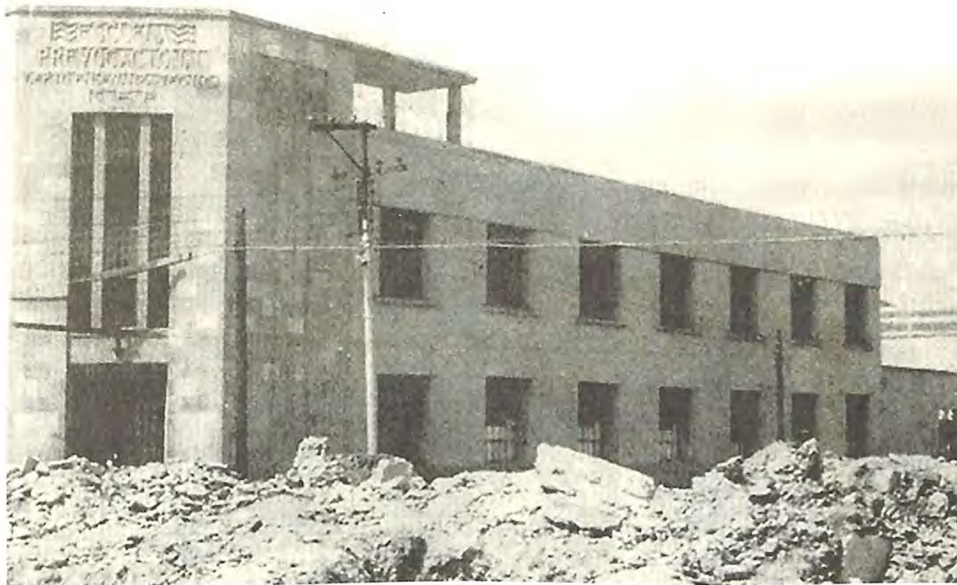
Fachada de la Prevocacional, durante las obras de construcción del Bulevar Adolfo López Mateos. (1963).