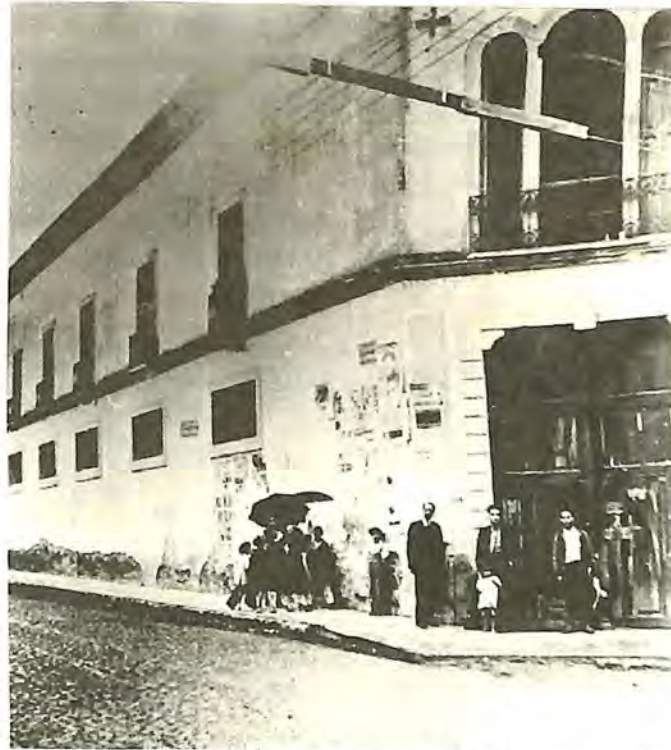
Beaterio, hoy Escuela Secundaria Técnica No. 1. 1910.

...y consuelo espiritual los fieles en el Colegio de la Compañía de Jesús, y edificación en la ejemplar vida de las señoras, que componen el Beaterio de las Jesuitas, único en las Provincias de esta América... 1