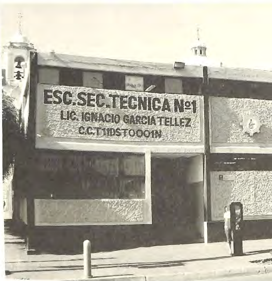
Actual fachada de la Institución.

Agregó que la fundación de la Prevocacional era una necesidad social de León, como centro