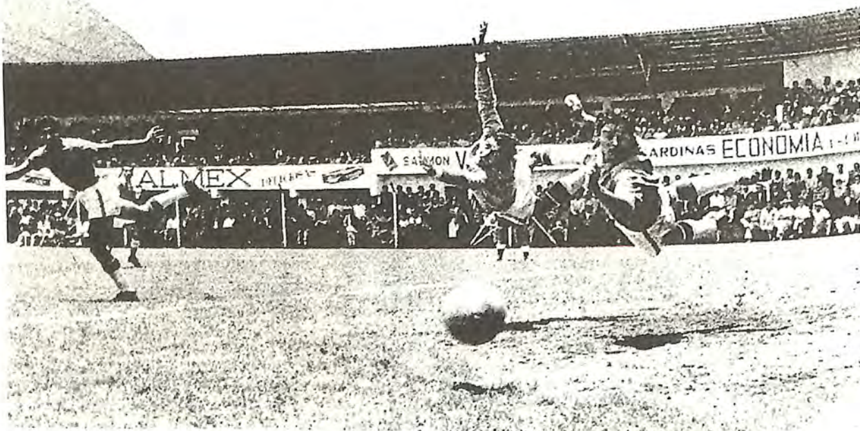
El León en acción con su central y el portero Antonio Carbajal.