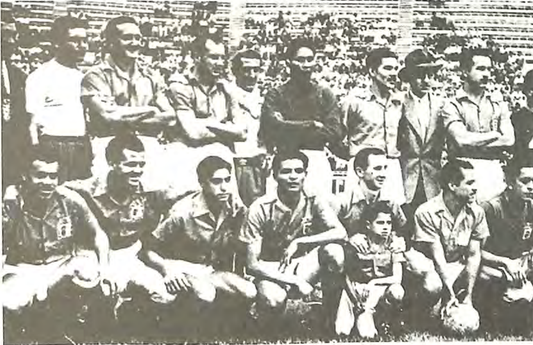
El equipo León bicampeón: 1948-1949.

Panzas Verdes, en los que se incluyen grandes goleadas como el 6-2 sobre el ADO, 47 el 9-0 al Marte y el 10-1 al Atlante. 48