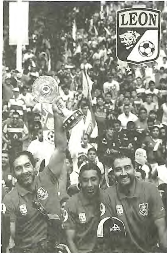
El regreso a las ligas mayores: 2012.