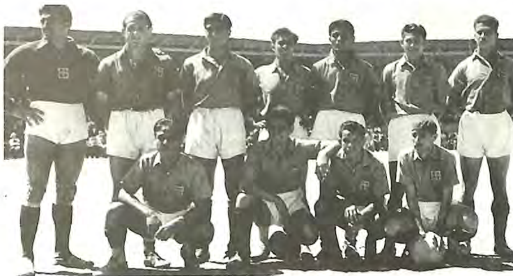
El primer equipo León.