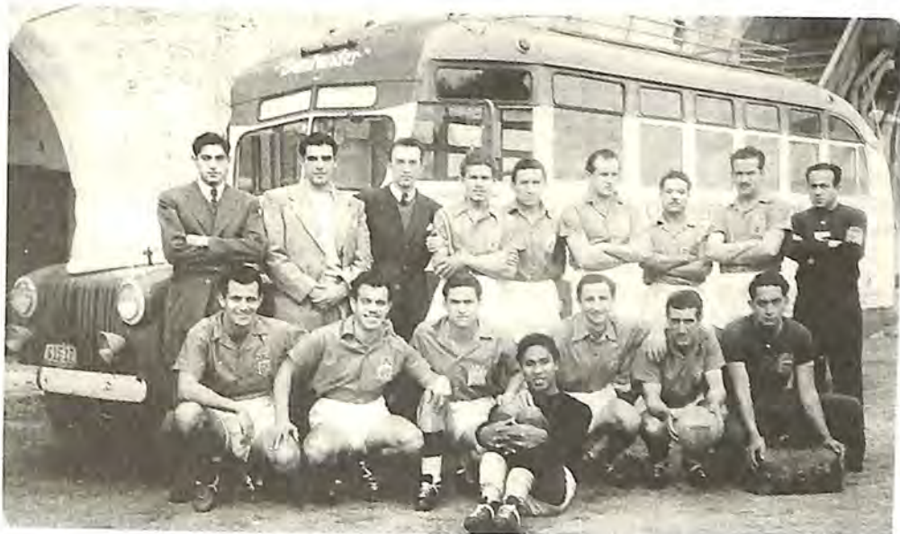
El León con su famoso camión "Santander".

Vendría el duelo contra el Toluca, Campeón de Copa, para determinar al Campeón de Campeones, en julio de 1956, León se impuso 2-1 en tiempos extras, en la Ciudad de los Deportes.