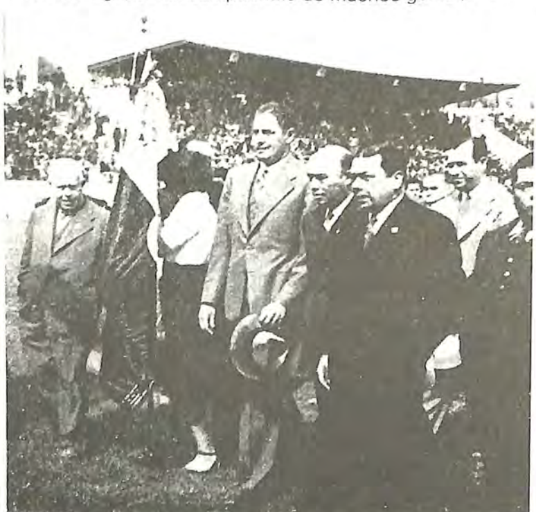
Inauguración del estadio Enrique Fernández Martínez

Fue 1948 el año de la revancha. El León logró su primer Título de Liga, en un campeonato de muchos goles para los