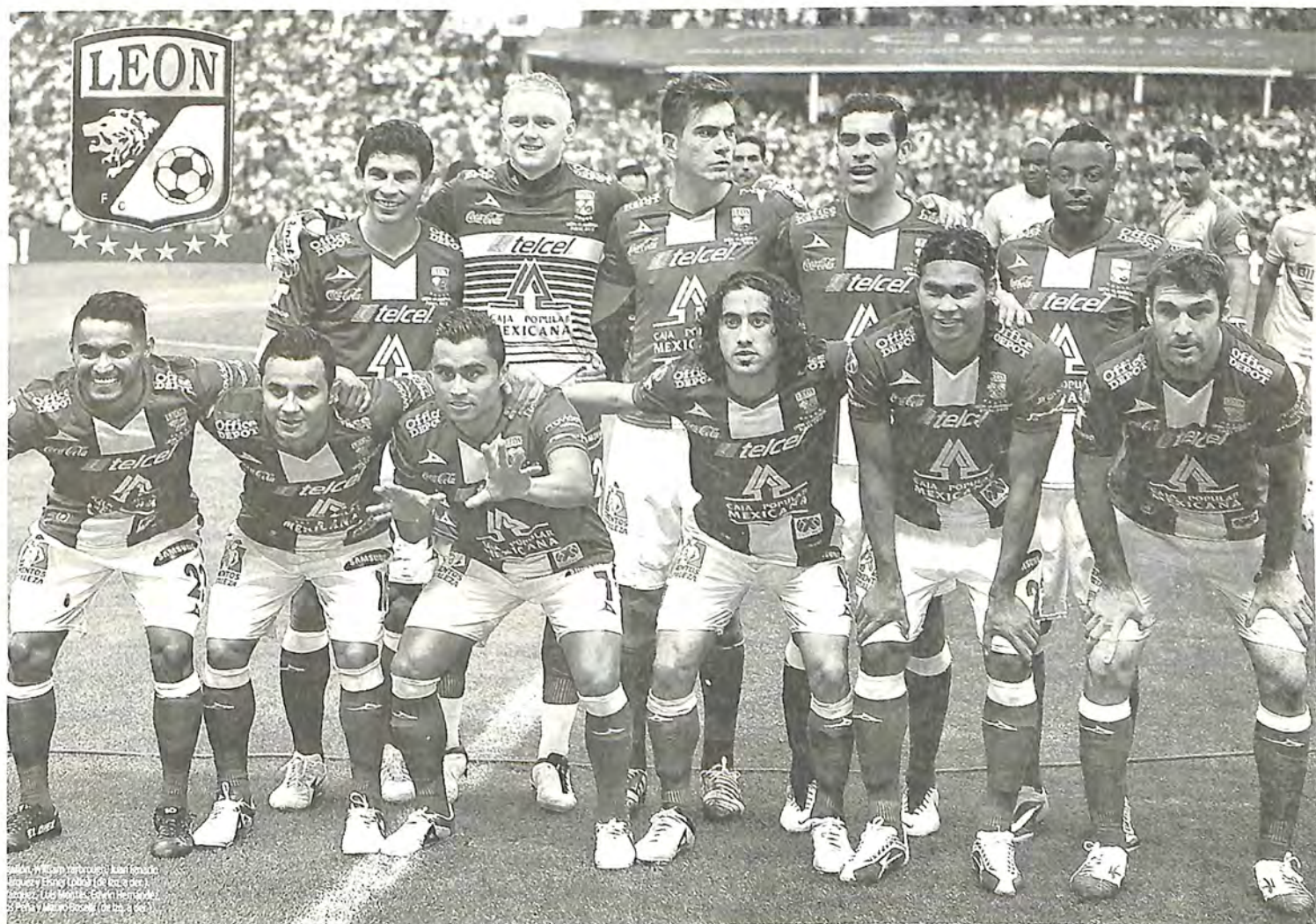
León, campeón del torneo de apertura 2013 del fútbol mexicano. Estadio Azteca.