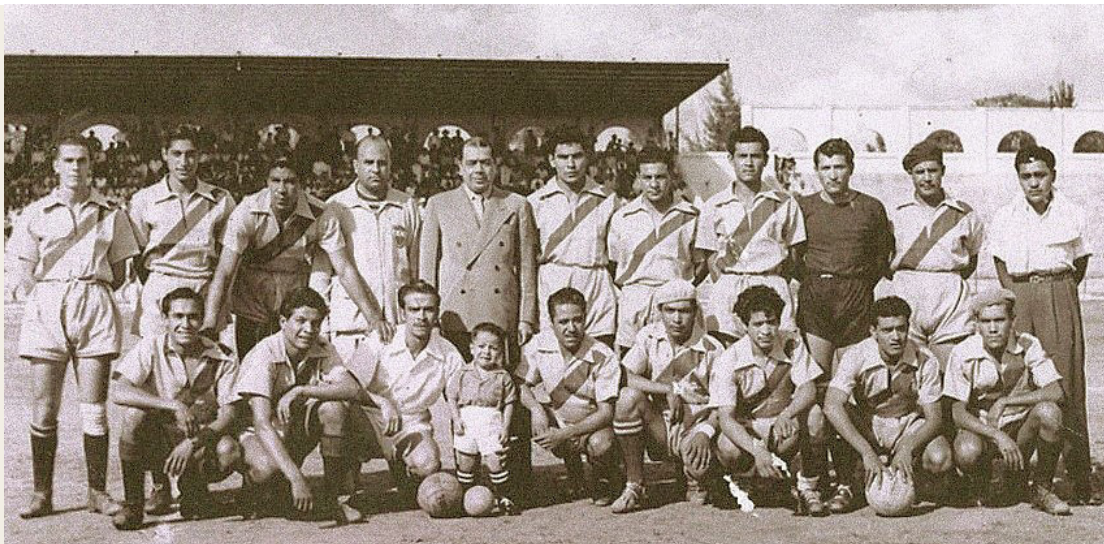
Unión de Curtidores de León, Guanajuato en el estadio Enrique Fernández Martínez en 1944.