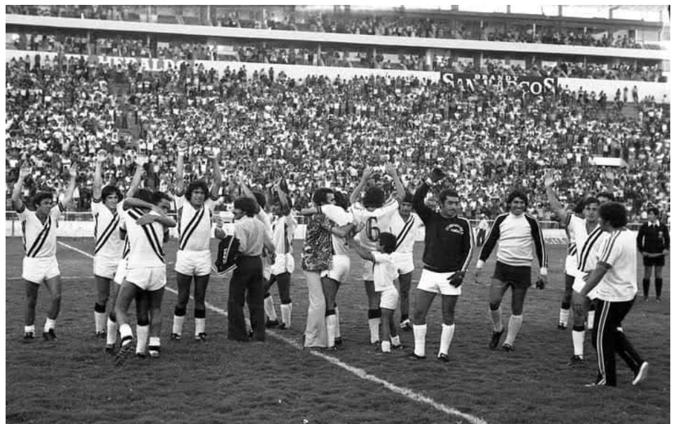
La mística del Unión de Curtidores , El Equipo que No Quería Perder .