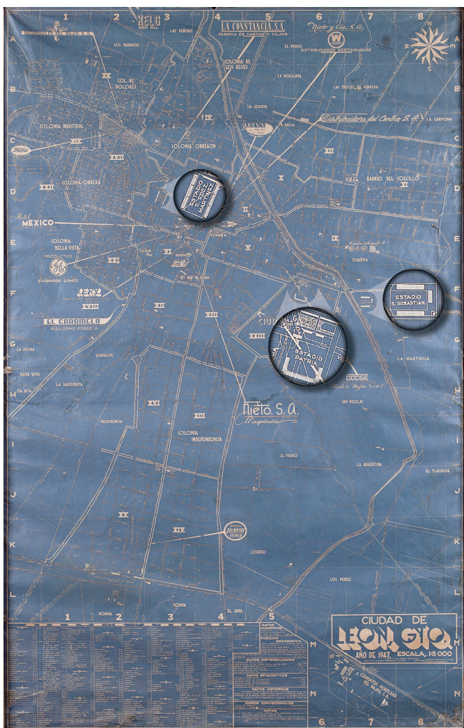
Plano de la ciudad de León del año 1947, en el que se perciben los tres estadios existentes en la localidad en los años cuarentas del siglo XX: Patria -construido para la práctica específica del béisbol-, Enrique Fernández Martínez y San Sebastián o Martinica . (Foto: Mapoteca del AHML).