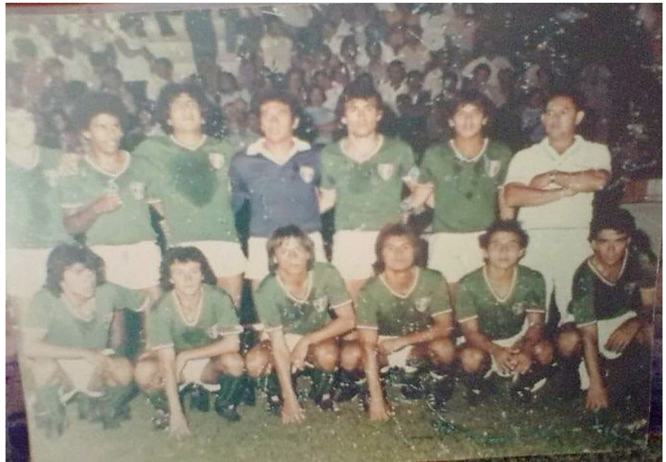
Selección Mexicana Preolímpica 1979 con diez futbolistas del Unión de Curtidores .