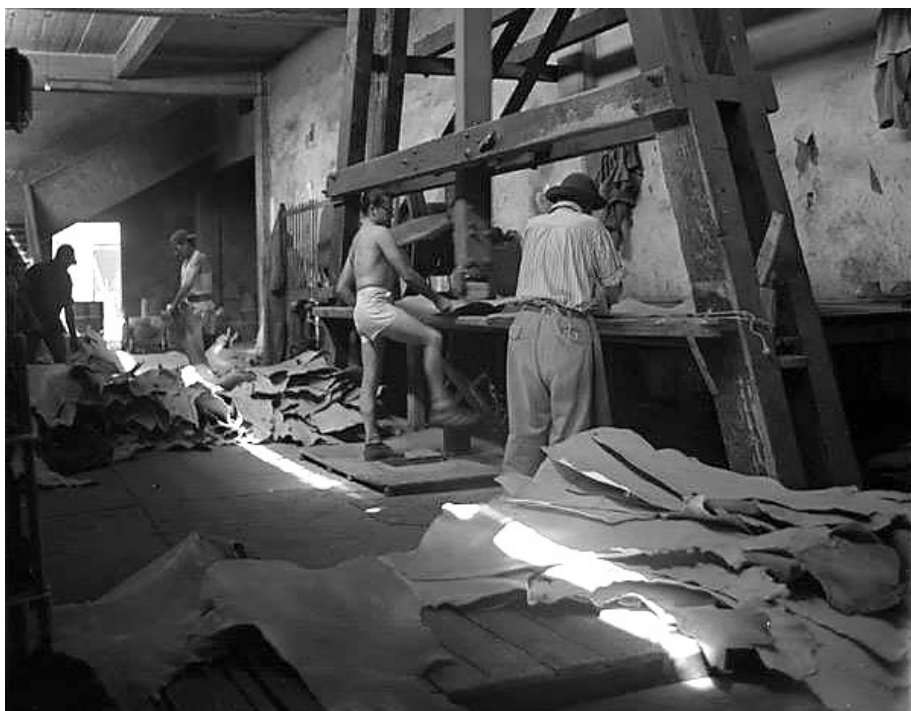
El equipo Unión de Curtidores , se integró con trabajadores del ramo, quienes después de la jornada laboral se reunían a jugar fútbol en una cancha que estaba cerca del kiosco del parque Hidalgo.