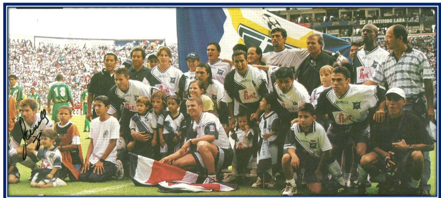
Final de Ascenso celebrada en el Estadio León el 20 de junio de 1999, entre Curtidores vs Yucatán.

En la actualidad, el Club Unión de Curtidores , se ha alejado del futbol profesional para continuar su misión desde la Academia. El compromiso es contribuir en la formación de niñas y niños en el deporte con los principios de su origen. La filosofía del respeto, la mentalidad