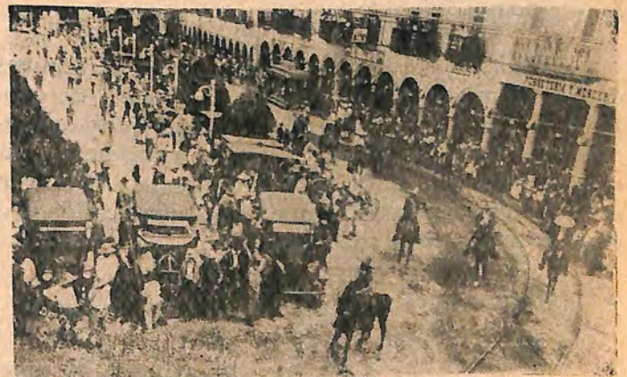
Grupo de charros no mistificados desfilando por la Plaza Principal, como descubierta del desfile del 16 de septiembre de 1923. Al fondo puede verse uno de los desaparecidos tranvías de tracción animal, y en primer término, solemnes automóviles sobre el flamante empedrado.

Transcripción del Documento No. XII, Legajo 7, Caja 1827-1.